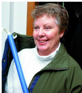
Crochet d'habillage / chausse-pieds