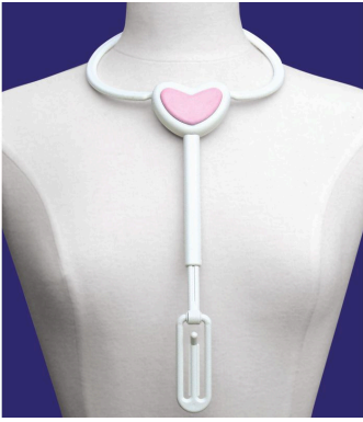
Accroche soutien-gorge Buckingham