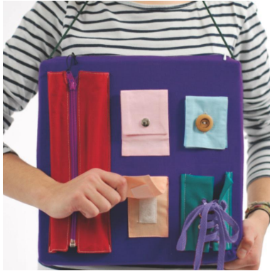
Coussin d'habillage pédagogique